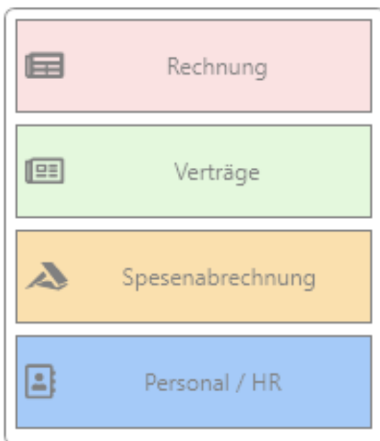
Bild: Dropzone Kacheln

Beim Ablegen von Dokumenten per Drag & Drop auf die jeweilige Kachel, wird ausgewählt welche Verschlagwortung für dieses Dokument gilt.